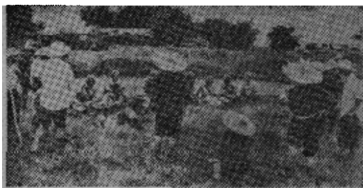
原图说明：打鼓岭罗芳村农民斗争矛头对准港英，要它低头认错。农民群众对港英指使的廓尔喀兵和华警进行政治教育，使认清是非曲直，不要做港英帮凶，等待时机，为同胞立功。