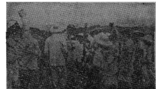
原图说明：港英无理封锁打鼓岭闸门，农民不能照常耕作，向港英当局进行交涉。港英警官在愤怒群众的质问下，无词以对，垂头丧气。