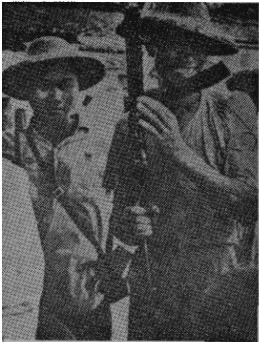
原图说明：农民群众从港英警官手中缴获的冲锋枪。