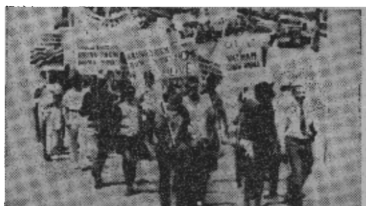
美国人民抬着“撤出越南”等标语牌游行，反对美帝侵略越南。

如果对个人附加税按计划于十月份实施，那么在一九六八年选举时现在的议员肯定会受到损害。总统将需要费很大的